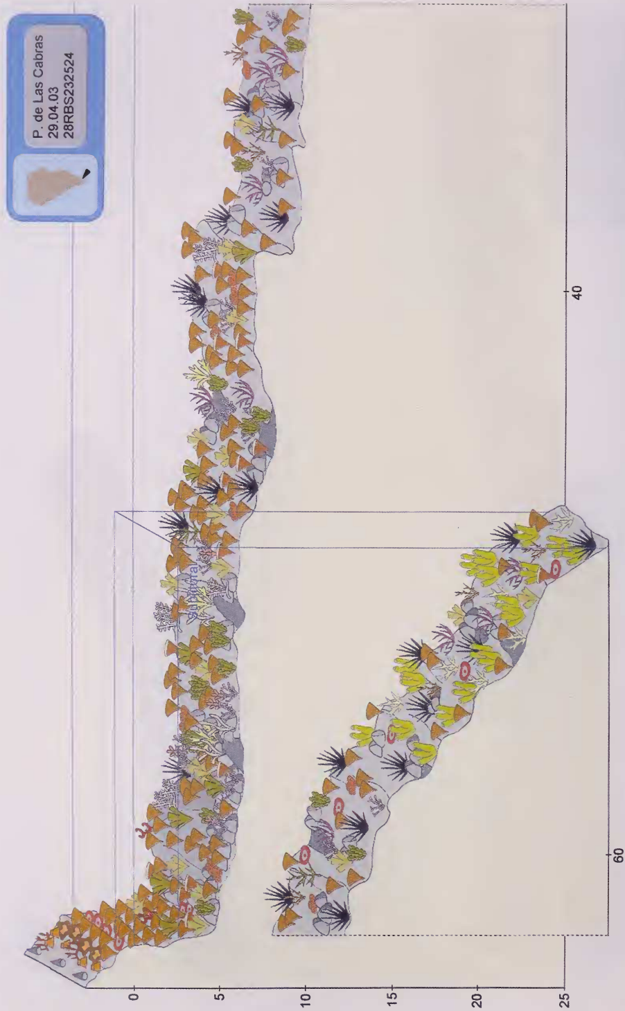
Fig. 5. Playa de Las Cabras. Esquema del perfil del litoral con la zonación de las especies dominantes.